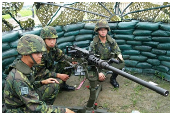
◎ 後備部隊戰力是國軍整體戰力一環，其運用與發揮必須與常備部隊密切協調配合。