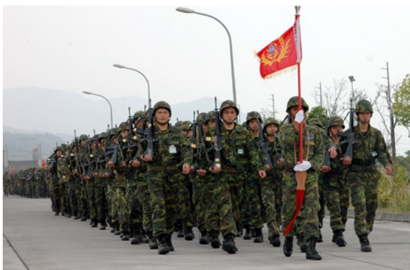
◎ 結合施政作為，完成人力、物力、財力、科技、軍事等綜合準備，以積儲戰時總體戰力。